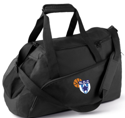
Sac de sport