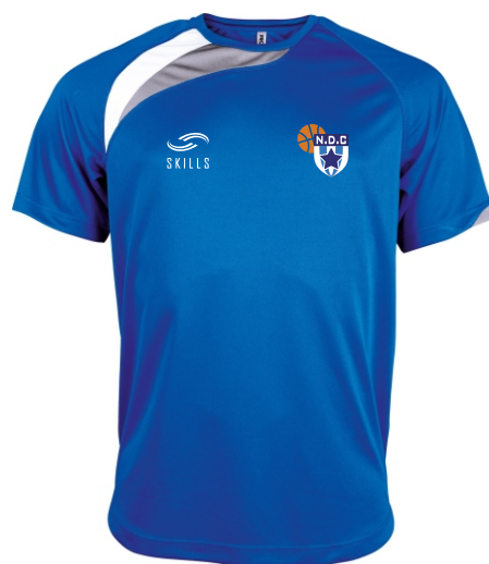
Prénom dos inclus