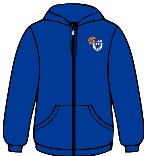
Veste capuche zippée